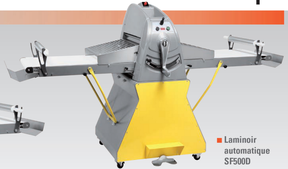
■ Laminoir automatique SF500D