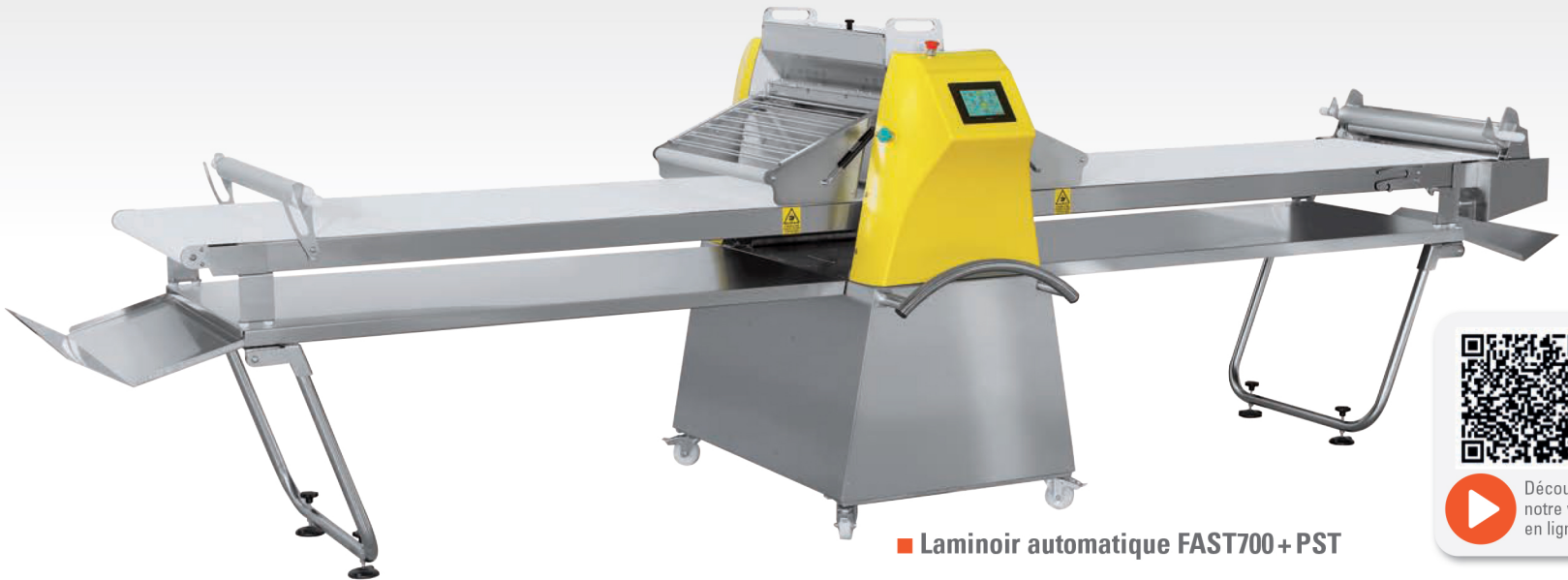
■ Laminoir automatique FAST700+ PST