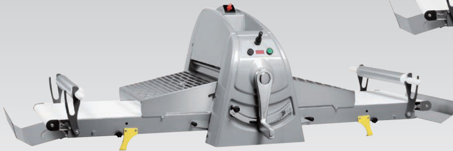
■ Laminoir de table