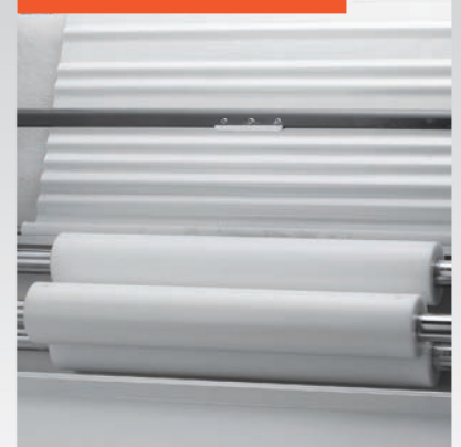
■ Rouleaux de laminage en polyéthylène alimentaire