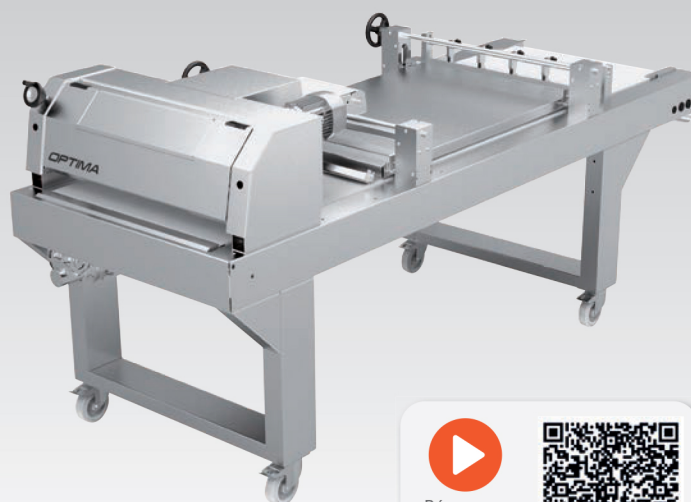
■ Façonneuse horizontale pour un respect total de la pâte