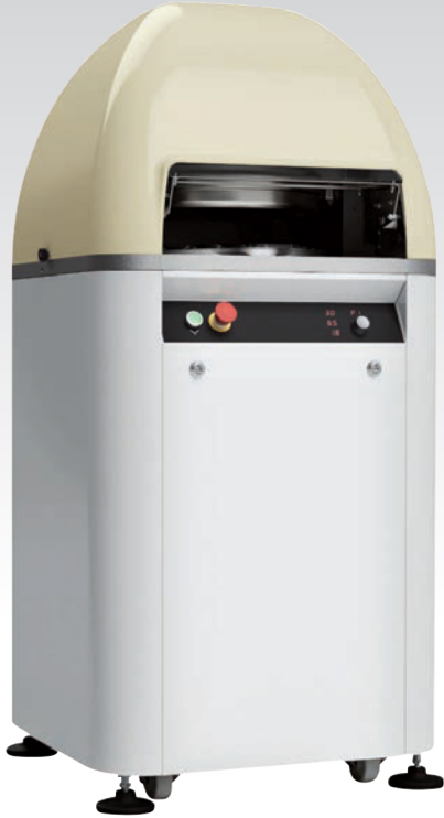
■ Diviseuse bouleuse automatique