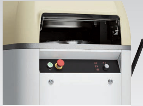
■ Diviseuse bouleuse semi-automatique