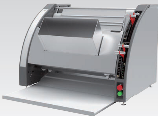
■ Façonneuse verticale pour un gain de place